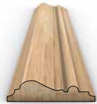
RAMA B 80x19