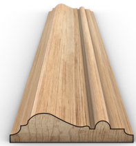
RAMA B 80x19